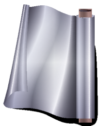
Фольга для запекания