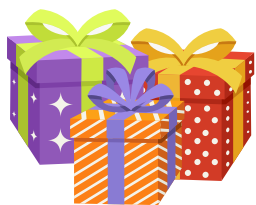
Подарочная оберточная бумага