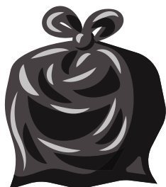
Мешок для мусора

Если полотенцем протирают поверхность, то можно заменить на многоразовую тряпочку.