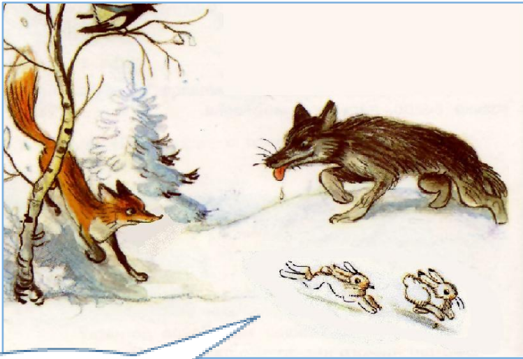
Хищничество и межвидовая конкуренция