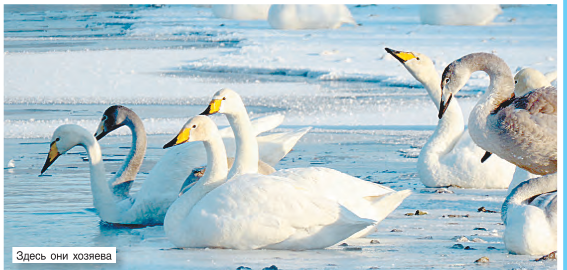
Здесь они хозяева

Наталья БАТЛУК