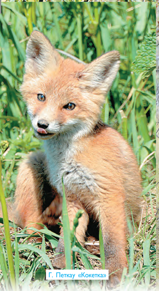
Г. Петкау «Кокетка»