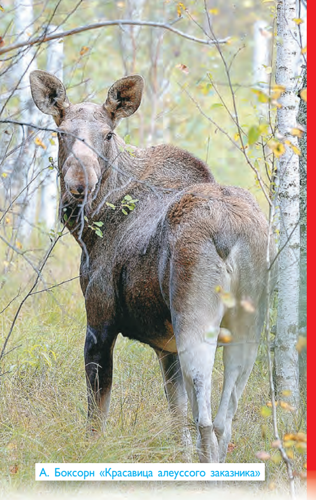
А. Боксорн «Красавица алеусского заказника»