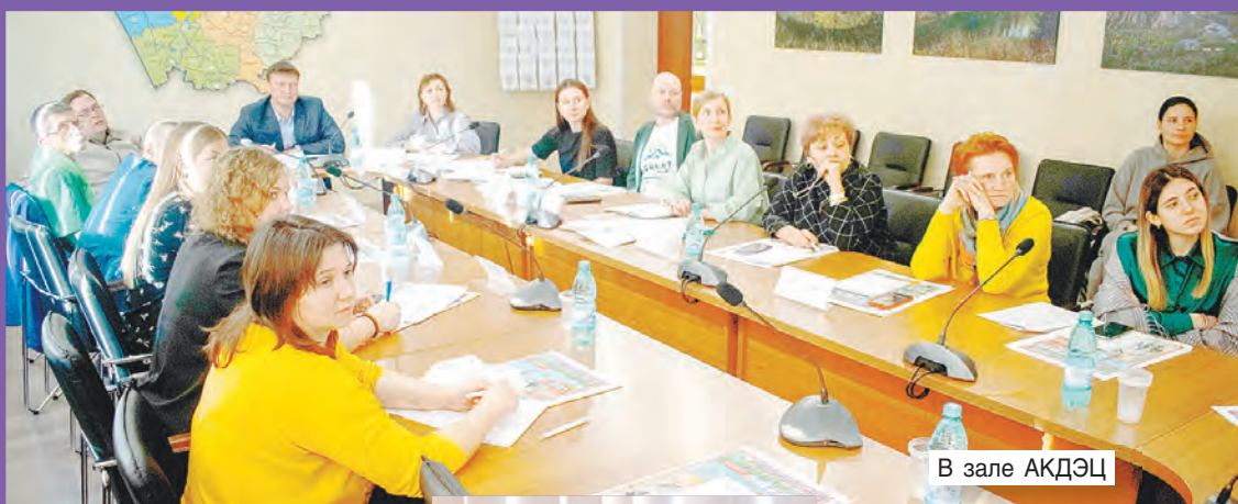
В зале АКДЭЦ

География дискуссии была необычайно широка: Алтайский и Красноярский края, Республика Алтай, Кемеровская и Томская области, Санкт-Петербург, Калининград. Это стало возможным благодаря организованной видео-конференц-связи.