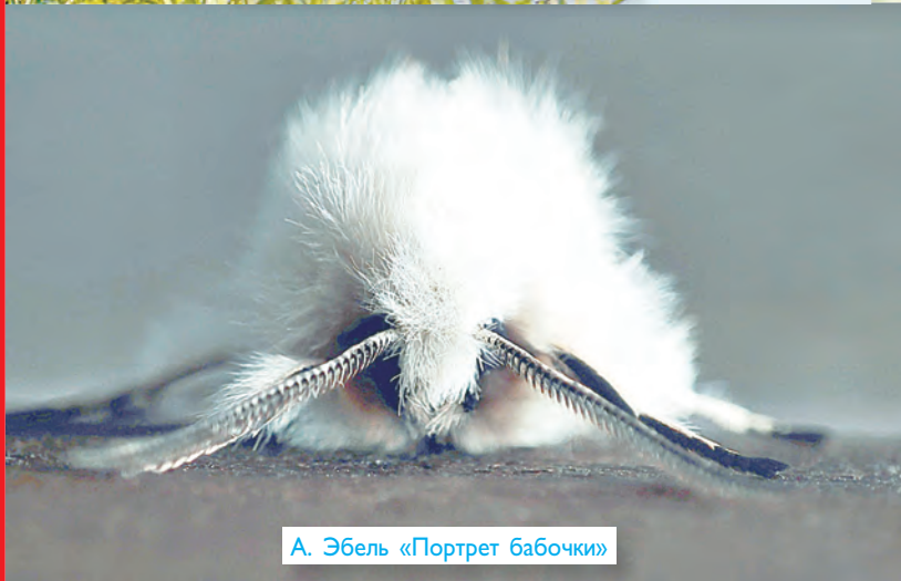
А. Эбель «Портрет бабочки»