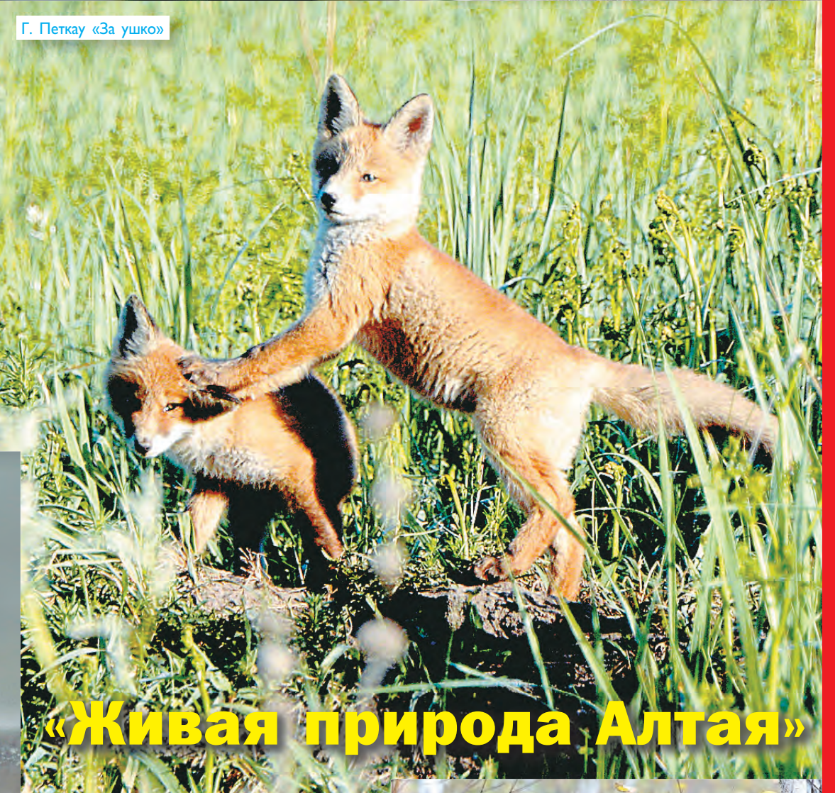
Г. Петкау «За ушко»