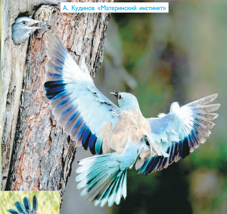
А. Кудинов «Материнский инстинкт»