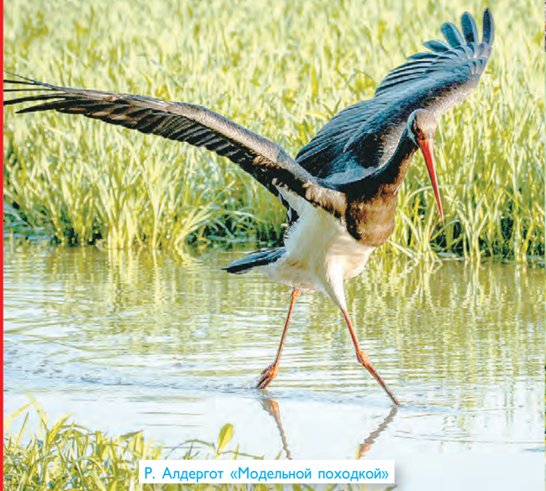
Р. Алдергот «Модельной походкой»