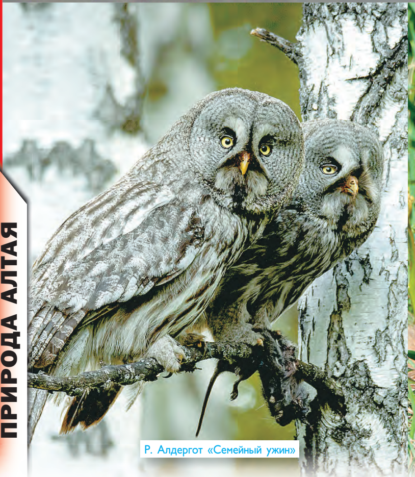
Р. Алдергот «Семейный ужин»