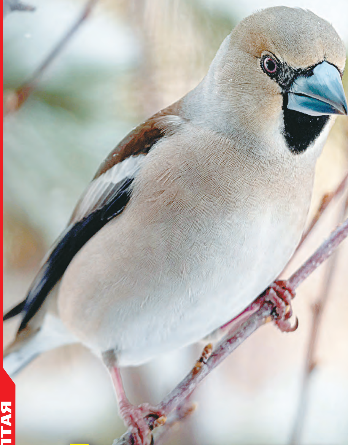
Фото Елены Рубан «Разбойник-дубонос»

ОБЩЕСТВЕННО-ЭКОЛОГИЧЕСКОЕ ИЗДАНИЕ № 1-2 (337-338) 2024 год 22 февраля 2024 года