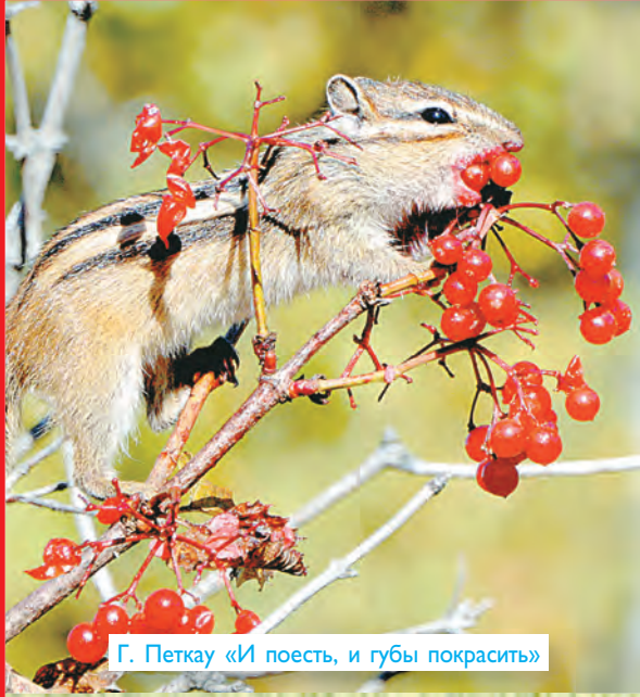
Г. Петкау «И поест, и губы покрасить»